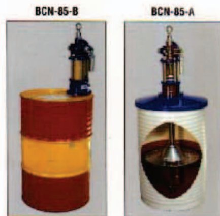
Bomba para aceite